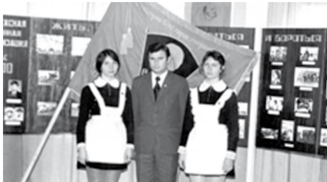
Прием в комсомол. Фото на память у знамени РК ВЛКСМ