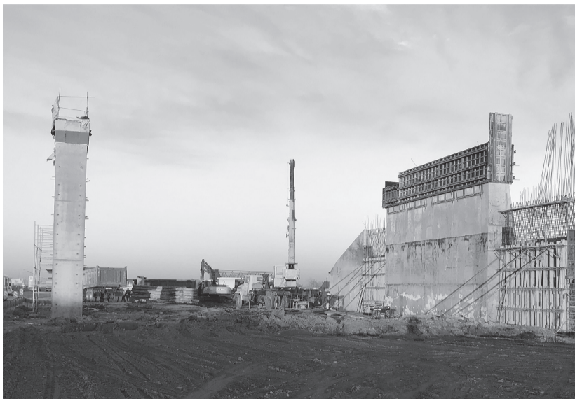
Строительство транспортной развязки на автомобильной дороге Энем – Новобжегоикай

Именно в совместном внимании к проблемам дорог: и со стороны специалистов дорожных служб, и со стороны неравнодушных граждан возможно достижение основного целевого показателя национального проекта «Безопасные качественные дороги» — обеспечение доли дорог региональной опорной сети, соответствующей нормативным требованиям, на уровне не менее 60 % к 2024 году.