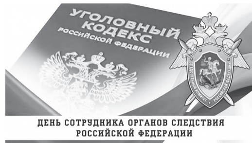
ДЕНЬ СОТРУДНИКА ОРГАНОВ СЛЕДСТВИЯ РОССИЙСКОЙ ФЕДЕРАЦИИ

В 1 полугодии 2022 года следователями отдела рассмотрено 365 сообще-