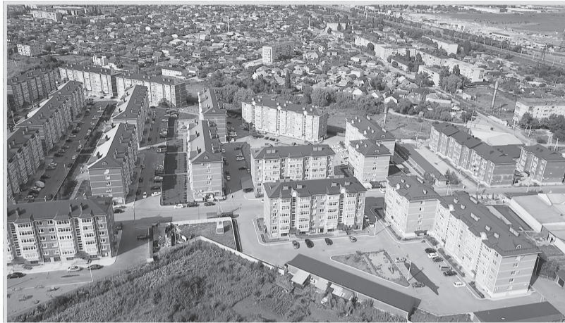
Поселок городского типа Яблоновский - благоустроенный и динамично развивающийся населенный пункт. Ежегодно здесь вводят в строй новые объекты инфраструктуры.

норму обеспечению, привлечению в республику узких специалистов, оснащению медучреждений современным оборудованием. По словам Мурата Кумпилова, задача по повышению качества медицинской помощи решается в рамках нацпроектов, программы модернизации первичного