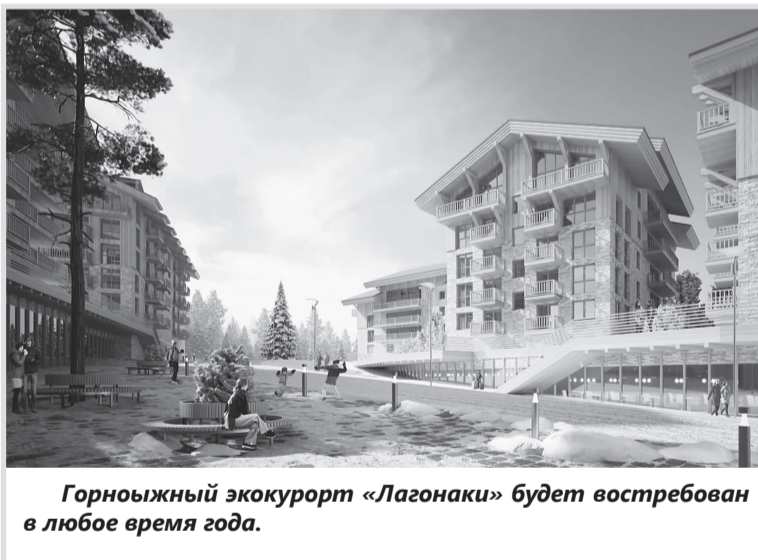
Горнолыжный экокорт «Лагонаки» будет востребован в любое время года.

В завершение Глава РА подчеркнул, что по всем поступившим вопросам будут даны поручения руководителям муниципалитетов, Кабмину РА. Их дальнейшее рассмотрение находится на контроле Главы республики. Мурат Кумпилов также поддержал прозвучавшие от жителей созидательные инициативы и принял предложение Президента федерации хоккея РА Ахмеда Чича. От имени всех хоккеистов республики (сегодня в регионе сформировано 3 детские и 7 взрослых команд) он пригласил Главу Адыгеи посетить одну из тренировок, которые проходят в Ледовом дворце «Оштен».