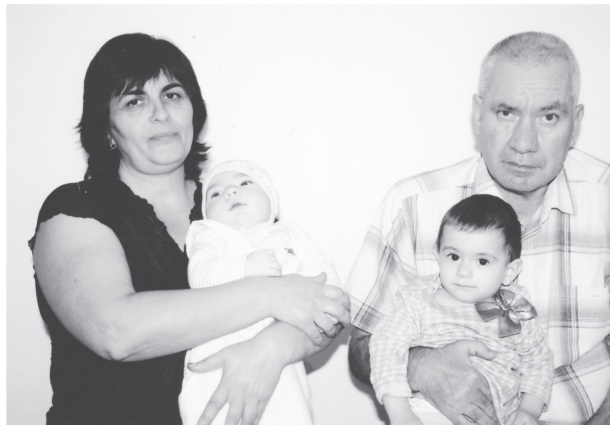
С супругой и внуками.

И им он посвятил книгу «Эхо древних синдов», полную патриотизма, человеколюбия, тепла, искренности. Как человек, не раз обращавшийся к истории района, принял участие в написании книги «Тахтамукай и тахтамукайцы».