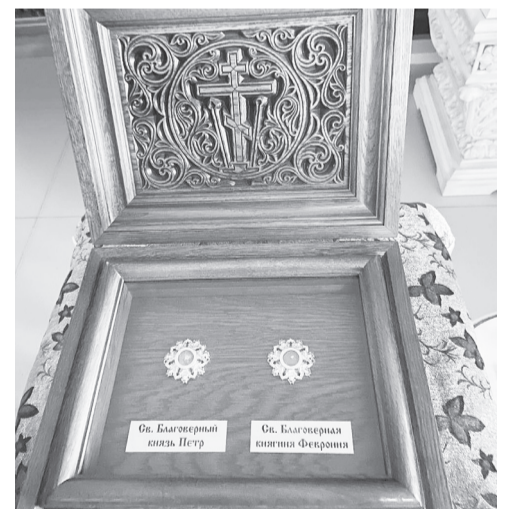
ГРАФИК ПРИНЕСЕНИЯ КОВЧЕГА С ЧАСТИЦАМИ МОЩЕЙ СВЯТЫХ БЛАГОВЕРНЫХ КНЯЗЕЙ ПЕТРА И ФЕВРОНИИ МУРОМСКИХ ПО ПРИХОДАМ МАЙКОПСКОЙ И АДЫГЕЙСКОЙ ЕПАРХИИ:

Перед смертью по благочестивому обычаю супруги приняли монашеский постриг с именами Давид и Ефросиния. Святые Петр и Феврония скончались в один день. Они завещали положить их в один гроб, который для себя приготовили. И по сей день мощи муромских чудотворцев покоятся в общей раке.