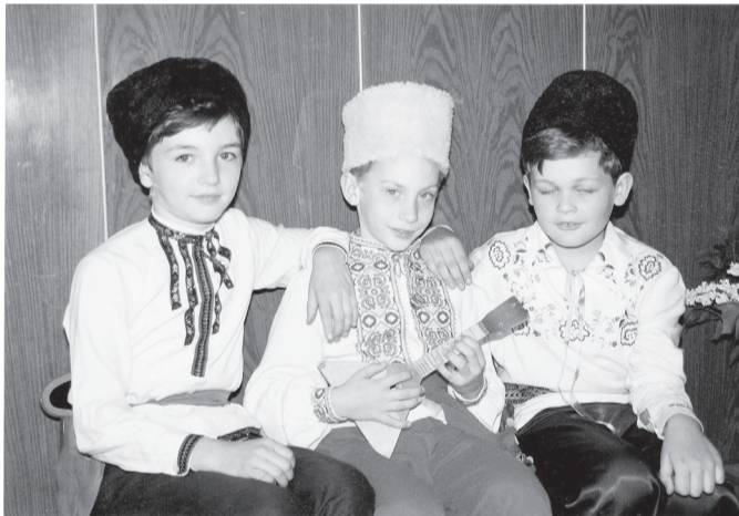
Фольклорный детский коллектив «Жаворонушки»

торге от юного дарования и сочла за большой успех, что Наталья выбрала именно их учреждение. Девушка точно знала, что хочет учиться именно на педагогическом отделении и выбрала специальность «Му-