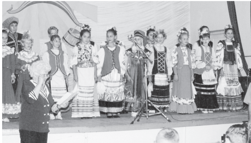
Образцовый детский фольклорный коллектив «Родничок»

Живо не только ее имя, но и ее дело. Ведь ансамбль «Родничок» вновь радуется своим творческими победами. А значит, жива добрая память об этом необычайно талантливым и прекрасном душой человеке.