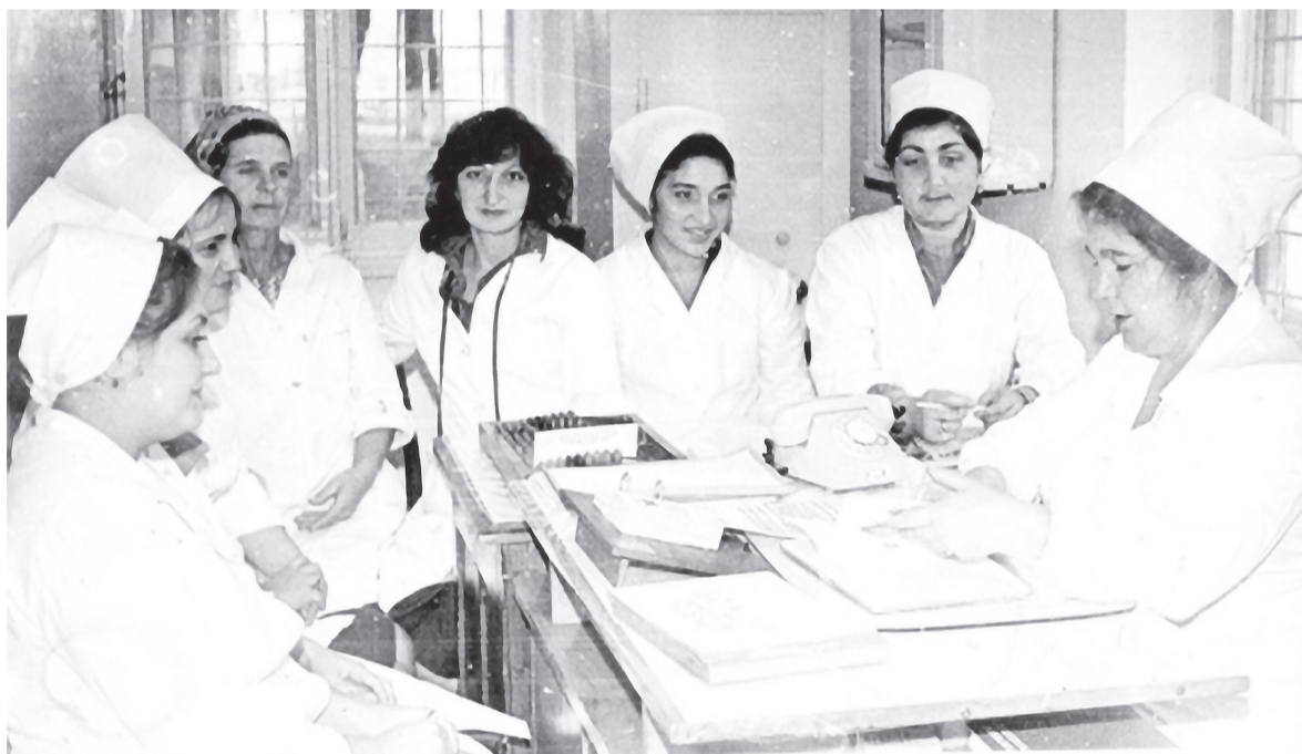
Коллектив работников аптеки. 1980-е годы

подсказать, к какому узкому специалисту нужно обратиться, какие анализы надо сдать предварительно, – говорит Саида.