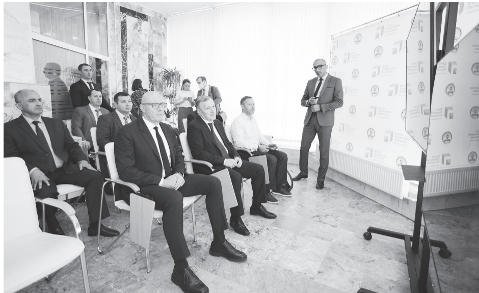
ЦУР Адыгеи отмечает четырехлетие с момента создания.

Основная задача ЦУР выполнена: в республике сформирована единая оперативная система взаимодействия жителей с органами власти по цифровым каналам связи. Ежедневно центр получает, координирует и оперативно обрабатывает обращения жителей по самым разным вопросам.