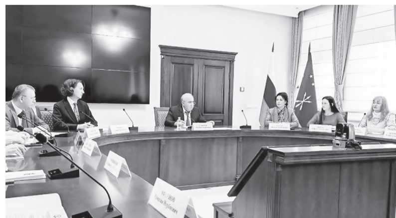
Схема одномандатных избирательных округов направлена в Государственный Совет – Хасэ Республики Адыгея для ее утверждения.

Средняя норма представительства на один депутатский мандат, исходя из численности избирателей на 1 июля 2025 года, составляет 13600 человек.