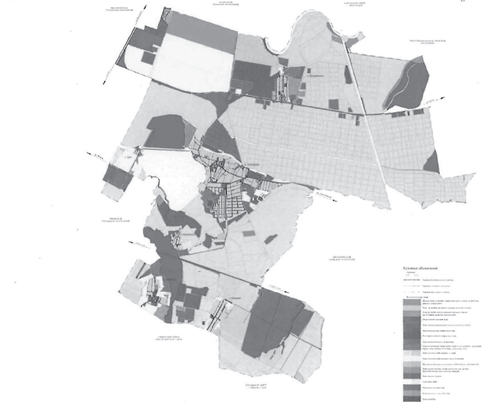
Приложение № 2 к Приказу Комитета Республики Адыгея по архитектуре и градостроительству от 19.02.2026г. № 14-ГПУ

Генеральный план муниципального образования "Тахтамукайское сельское поселение" Тахтамукайского района Республики Адыгея. Карта функциональных зон поселения или городского округа. М 1:25000