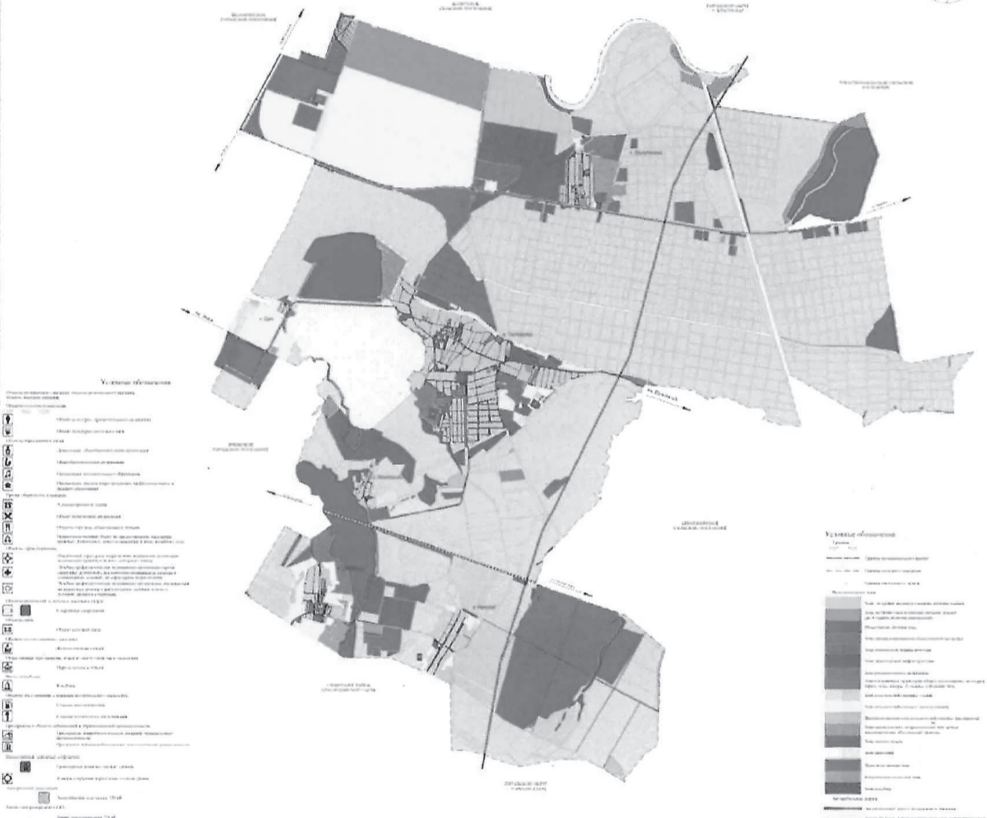
Приложение № 3 к Приказу Комитета Республики Адыгея по архитектуре и градостроительству от 19.02.2026г. № 14-ГПУ

Генеральный план муниципального образования "Тахтамукайское сельское поселение" Тахтамукайского района Республики Адыгея. Карта планируемого размещения объектов местного значения поселения. М 1:25000