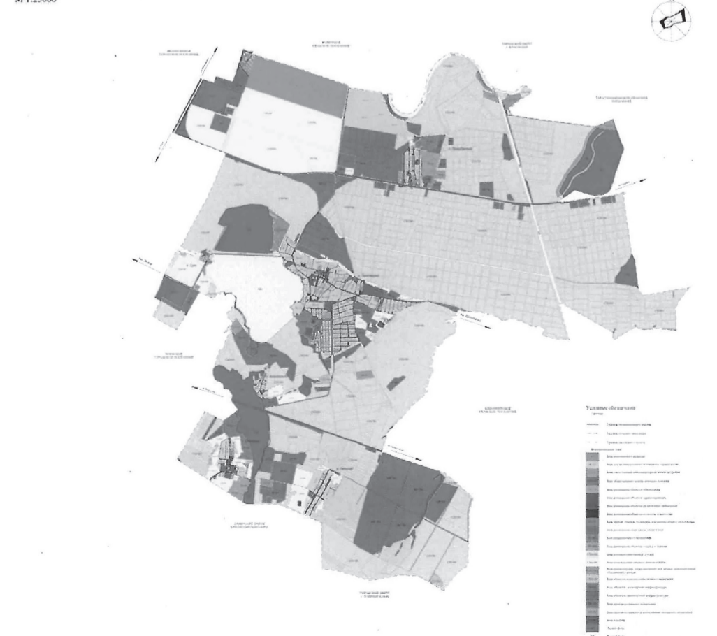
Правила землепользования и застройки муниципального образования «Тахтамукайское сельское поселение» Тахтамукайского района Республики Адыгея. Приложение №1 и План Комитета РА по архитектуре и градостроительству № 14-ПЗЗУ от 19.02.2026 г.

Приложение № 1 к Приказу Комитета Республики Адыгея по архитектуре и градостроительству от 19.02.2026г. № 14ПЗЗУ