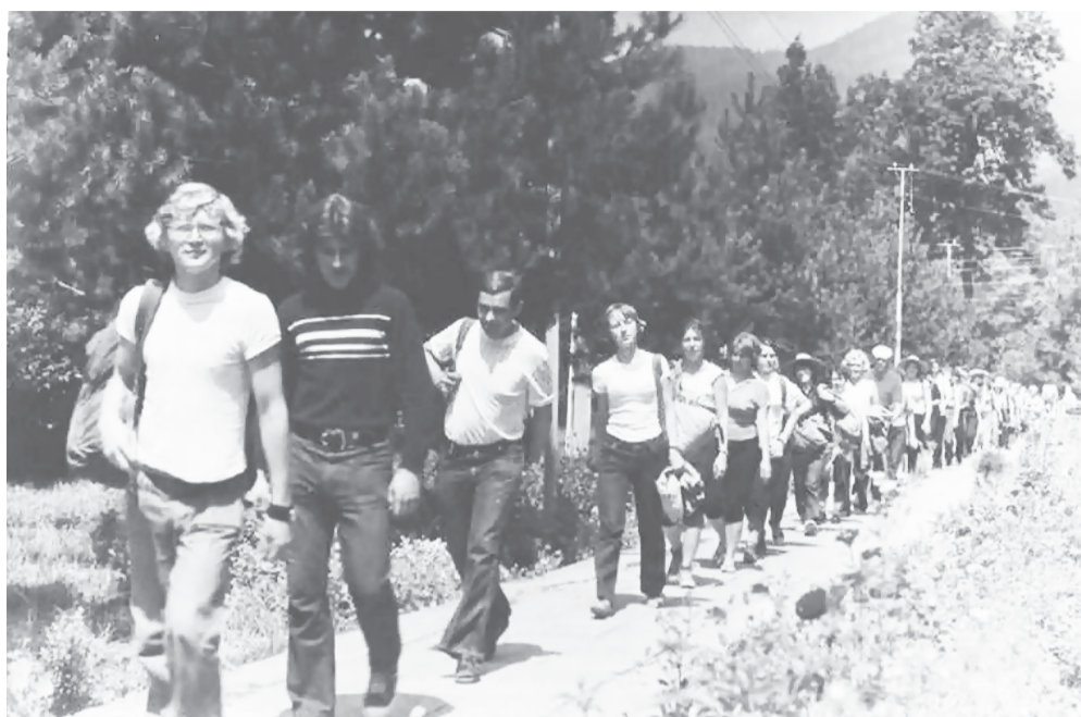
На Всесоюзный маршрут №30 «По Западному Кавказу» вышла очередная группа туристов.

С 1960 года началось бурное развитие туризма. По всей стране стали активно соз-